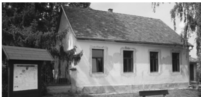
Megújul a tanítólakás

A fenti címen Sé és Torony községekkel közös pályázatot nyújtottunk be még a tavalyi esztendőben a Pannon Élmény Program