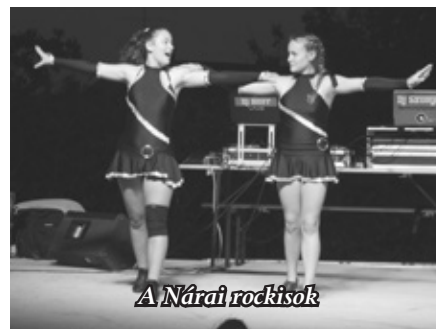
A Náriai rockisok