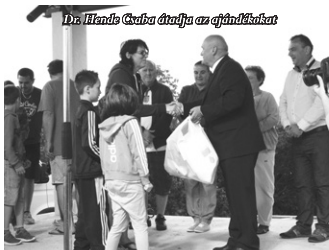
Dr. Hende Csaba átadja az ajándékokat