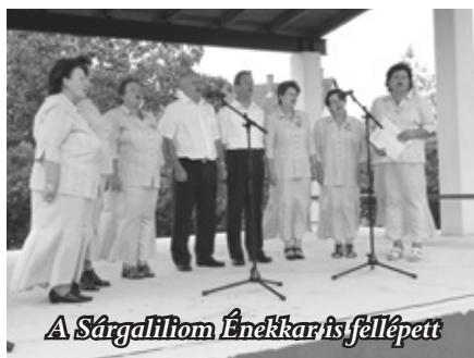
A Sárgaliliom Énekkar is fellépett