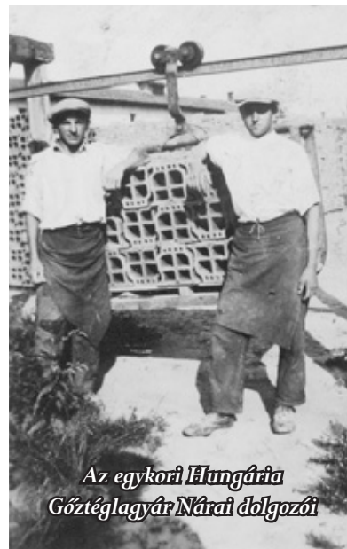
Az egykori Hungária Gőztéglagyár Nárai dolgozói

Napjainkban is ugyanúgy látni a robbantások nyomait, mint hetven évvel ezelőtt. Több mint húsz krátert számolhatunk, amolyan minitavat. A környezet háborítatlan, itt a fák lábon dőlnek és válnak az