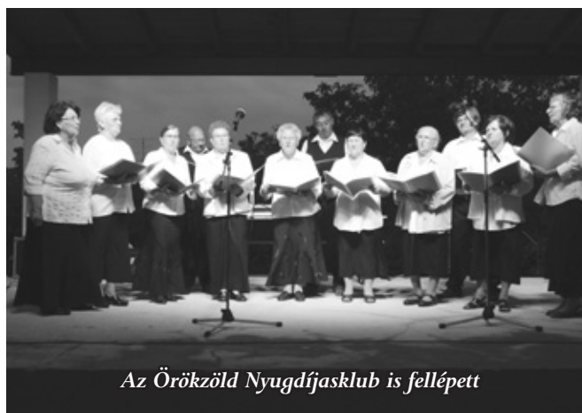
Az Örökzöld Nyugdíjasklub is fellépett