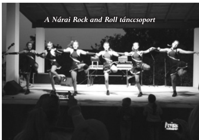
A Náriai Rock and Roll táncsoport