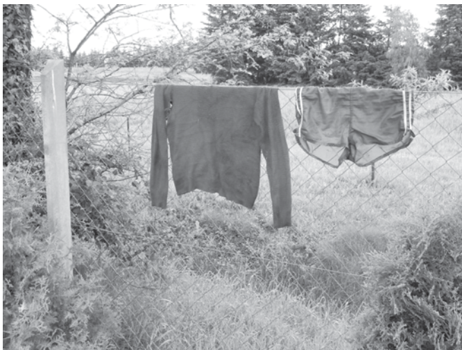
Migránsok által hátrahagyott ruhák a Náriai temetőben

Május 13-ára péntekre virradóra migránsok éjszakázhattak a Náriai temetőben. Feltehetően a nagy eső miatt jöttek be a települést északról elkerülő erdei és mezői utakon történő átha-