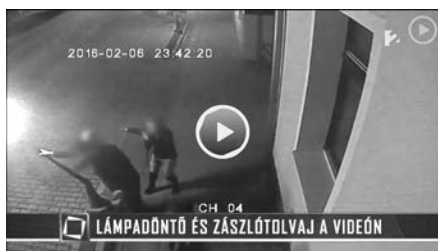
Kitört a kandeláber – TV2 Tények adása