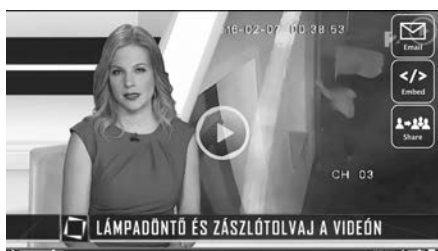
A TV2 Tények adásában a nárai zászlótolvaj