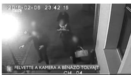
Érkezik a garázda társaság – két férfi és három nő – RTL Híradó