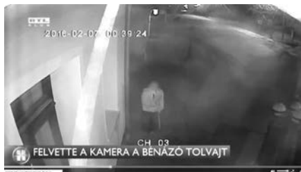
Majd a kabátja alá teszi és elsétál vele, de kilátszik a zászlónyel – RTL Híradó

Egy vidám garázda társaság kötött bele egy kandeláberbe még február hatodikán éjjel, majd egy tolvaj ugyanazon az éjszakan ellopta a polgármesteri hivatalról az újszülötteket köszöntő zászlót. A magánadományokból készült térfigyelő kamerarendszernek köszönhetően mindezt rögzítve lett. A felvételeken is jól látszik, hogy már biztosan nem voltak szomjasak, amikor a kandeláberrel és a zászlóval ujjat húztak. Amikor az incidens történt, két éjszakába nyúló esemény is volt a faluban, a rönkhúzás és egy tekebajnokság. Annak különösen örülünk, hogy a felvételeket visszanezve kiderült, egyik elkövető sem a rendezvényekről érkezett, hanem feltehetően azokhoz kapcsolódóan jelentek meg alkoholfogyasztási szándékkal az italméréseknél. Garázdaság miatt a büntetőfeljelentést megtettük, a kamerafelvételek a rendőrség részére átadásra kerültek.