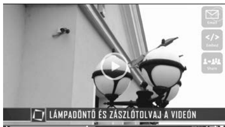
A TV2 felvételén is jól látszanak a kamerák, amelyek az eseményeket rögzítették