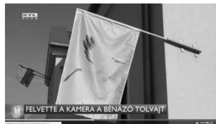
Azóta pótoltuk a zászlót, amely országosan egyedülálló. Csak Náraiban köszöntik zászlóval az újszülött csecsemőt – RTL Híradó