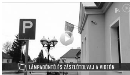
A TV2 felvételén is jól látszanak a kamerák, amelyek az eseményeket rögzítették