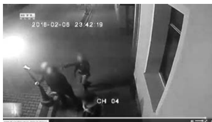
Majd kitörik a kandelábert – RTL Híradó