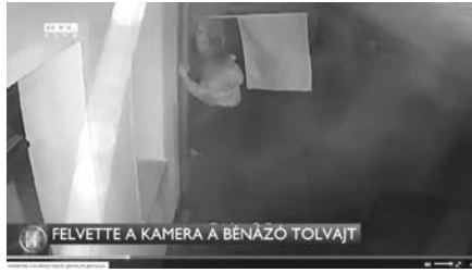
A tolvaj ellopja a születés zászlóját – RTL Híradó