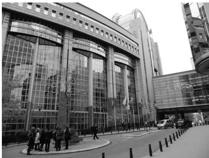
Brüsszel, Európa Parlament

Parlament magyar referense. Megtudtam, az EU parlamentben össznmzetgazdasági szinten Magyarország viszonylag nem prob- lémás, a görög, spanyol és a portugál helyzet sokkal aggasztóbb. De például Szerbiára is kiemelt figyelem jut, hiszen a lakosság 30%-a, a fiatalok 50%-a munkanélküli. Ma Magyarország egyik kiemelt fő problémája a népességfogyás megállítása, a diplomá- sok itthon tartása. Nehéz elhinni, de az elmúlt tíz év alatt közel 500.000 magyar hagyta el az anyaországot, meglehetősen végérvénye- sen. Ha eszünkbe jutnak a két világháború és az 1956-os vesz- teségek, azok mellett ez a szám megdöbbentő! Hogy mégsem vagyunk 9,5 millióan, ez annak köszönhető, hogy Erdélyből kö- rülbelül ugyanennyien települtek át hozzánk. De például a len- gyelek, csehek nem tudták pótolni veszteségeiket. A tendencia azt mutatja, az EU alapító országok fiatal népessége nő, míg a később csatlakozottaké csökken. Ez azért alakul így, mivel az ala-