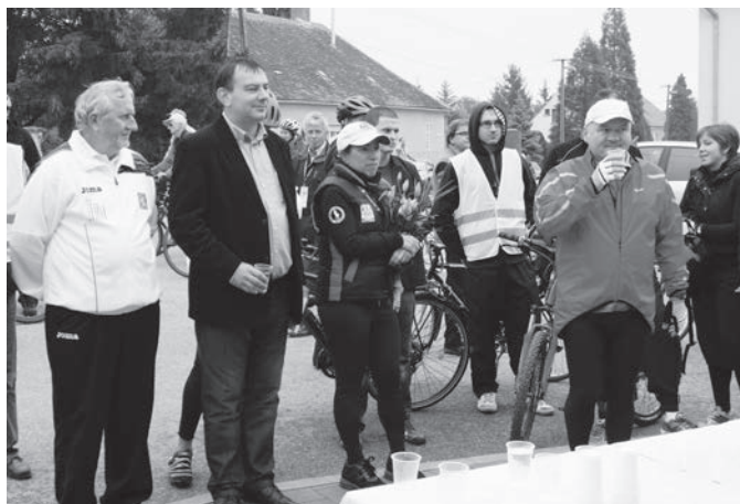
Tekerj a sereggel!