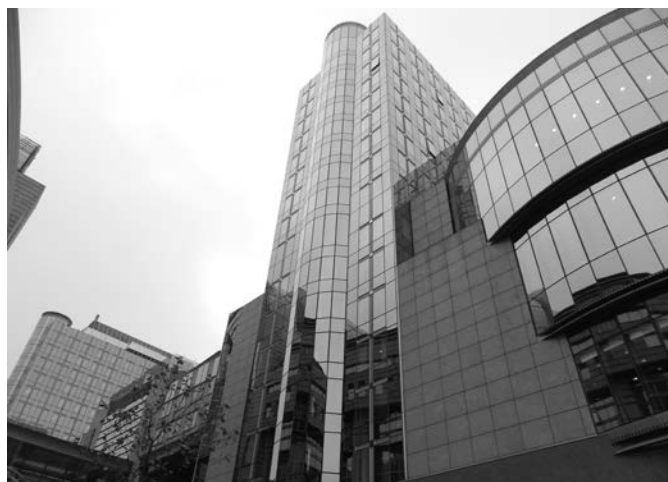
Brüsszel, Európa Parlament

indítani, az oktatásba többletpénzt investálni. Így már érthető, hogy miért fordít a magyar kormány a frissdiplomásokat itthon tartására ekkora figyelmet. Az egyik este felkerestünk egy több mint háromszáz éves tradicionális brüsszeli sörözőt is, ahol 2600 féle sör közül választhat a betérő. Igaz, a három szinten akár ezer ember is jól megfér egymás mellett. A kötetlen beszélgetések is alkalmat kínáltak a kapcsolatok mélyítésére. Számomra tanulsá- gos volt, hogy mint köztudott, az EU-ban törvény tiltja a klóno- zott állatokból készült húskészítmények forgalmazását. Azonban