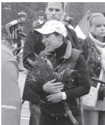
Eleni Tsakopoulos Kounalakis, az Amerikai Egyesült Államok nagykövetasszonya a biztonságiak gyűrűjében