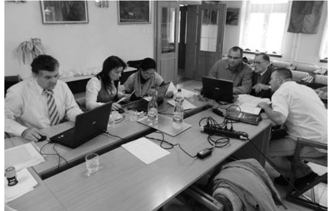
Folyik a pályázatok előkészítése tanácsadóinkkal a Polgármesteri Hivatalban

Unió pályázatok. Rástartoltunk, Náráit érintően öt újabb projektet nyújtottunk be. Kettőt épületfelújításra és három játszóterépítésekre.