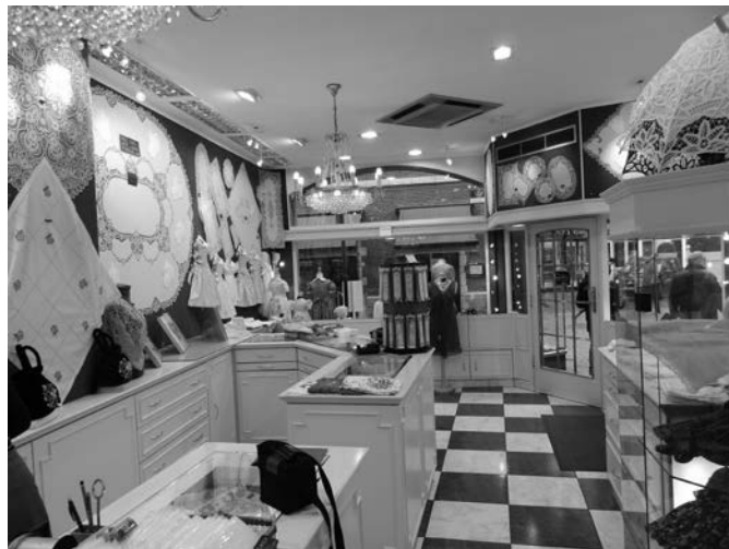
Tradicionális brüsszeli csipkebolt

a befektetőcégek, húszüzemek felismerték azt a kiskaput, hogy ez nem vonatkozik a klónozott egyedek szaporulataiból készült hús- készítményekre. A magyar EU parlamenti képviselők másokkal együtt már három alkalommal próbálták bevenni a tilalom alá