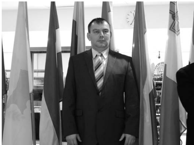
Brüsszelben az Európa Parlament aulájában a Magyar zászlónál

munkájába, az Európai Unió intézményrendszerébe, a várható pályázati, támogatási irányokra. Találkozhattam és eszmecsé- rét folytathattam többek között Láng Péterrel is, aki az Európa