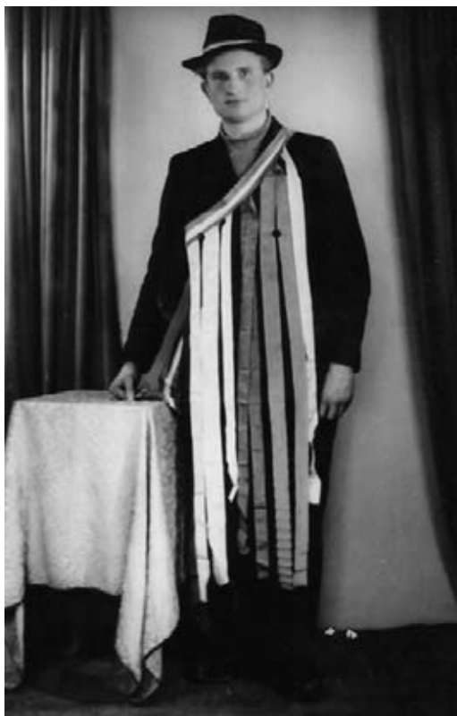
1958-ban, 20 évesen regrutaként