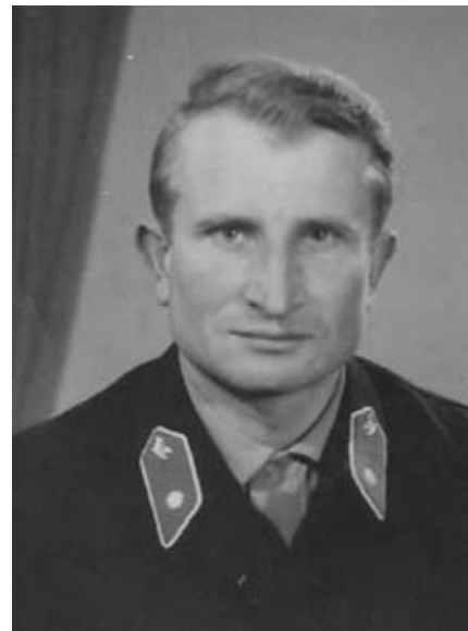
Fiatal korában, kézbesítőként