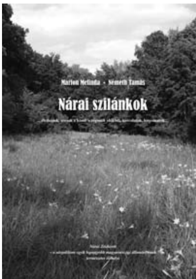
A Nárai szilánkok könyv borítója

időre történő befizetésére! Sajnos az őszi, szeptember 15-ei befizetési határidőt nagyon sokan nem vették figyelembe, így a minap 124 személy részére postáztunk fizetési felszólítást! Talán nem mindenki előtt világos, ezért kiemelem, hogy a határidőn túli befizetésekre pótléktól kell kivetnünk – ami az önkormányzatnak nyilván előnyös kamatozást biztosít –, azonban mi mégsem így szeretnénk pluszbevételre szert tenni. Minekután a rendszerünk a Magyar Államkincstáréval kompatibilis, így sajnos a pótléktól eltekinteni sem tudunk. Minél később rendezi valaki fizetési kötelezettségét, annál magasabb pótlék fogja terhelni. Bizonyos idő eltelte után aztán kikerül a kezünk közül az „ügy”, innentől fogva az APEH fogja adók módjára behajtani, fizetésből, nyugdíjból letiltani, esetleg kezdeményez végrehajtást. Sajnos ez utóbbira, de a fizetésből letiltásra is volt már példa, ne hagyják, hogy eddig jusson! Kis odafigyeléssel mindez megelőzhető, kérem figyeljék a befizetési határidőket, mert már egy nap csúszás után is pótléktól számol a rendszerünk!