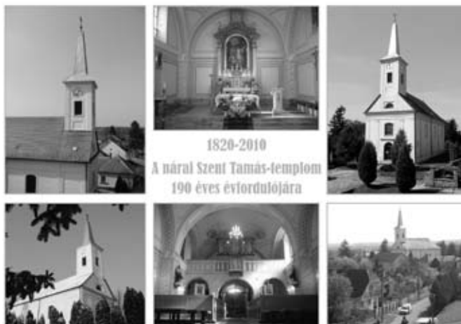
A 2010-es képeslap