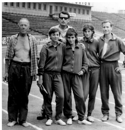
Országos Sportnapok a Népstadionban

„1939. július 7-én születtem Náraiban. Szüleim és tanárain segítségével határoztam el, hogy pedagógus leszek. 1958-ban szereztem tanítói oklevelet, majd történelemből felsőfokú tanári végzettséget 1970-ben. Sorikifaludra kerültem tanítani, majd 1959-től 1977-ig szülőfalumban dolgoztam. Pedagógiai munkám elismeréseként 1965-ben, 26 évesen a megye legfiatalabb igazgatója lettem. Általános isko-