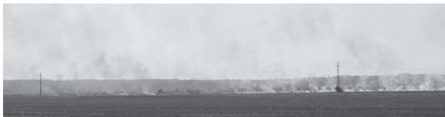
45 hektáron égett a búzatábla

hetőséget akadályozta a Kossuth Lajos utcában a labdarúgópályánál az út mindkét oldalán parkoló autók sokasága. Később már a tűzoltóautók Ják irányából közelítették meg a tüzesetet.