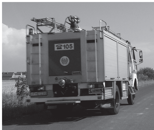
Vízért indult a tűzoltóautó

Nagy erővel vonultak ki a tűzoltók 2008. július 27-én, vasárnap délután négy órakor, amikor kigyulladt egy 45 hektáros búzatábla Nárai és Ják között. Az oltásnál a tűzoltók 6 autóval vettek részt. A tűz oltását nehezítette az erős szél, és a beázott talaj is. Ez utóbbi miatt a tűzoltóautók nem tudtak rámenni a földre, így a tűzoltóknak gyalogosan kellett megközelíteni a bokáig érő sárban az égő búzatáblát. A tüzet a lánglovagok mintegy másfél óra után körülhatárolták és megfékezték, emberélet nem volt veszélyben, viszont az anyagi kár tetemes. Sajnos az erős szél miatt, szinte a teljes tábla megsemmisült. A megközelít-