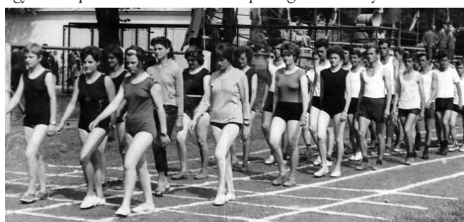
Megyei tömegsport-döntő Kőszegen

zik a hárs, Falusi verebek, A kőszívű ember fiai. Sok időt szenteltem a fiatalok sportolásának szervezésére, aktív sportoló voltam, egyben a sportkör elnöke is. Sok sportágban versenyeztünk: atlé-