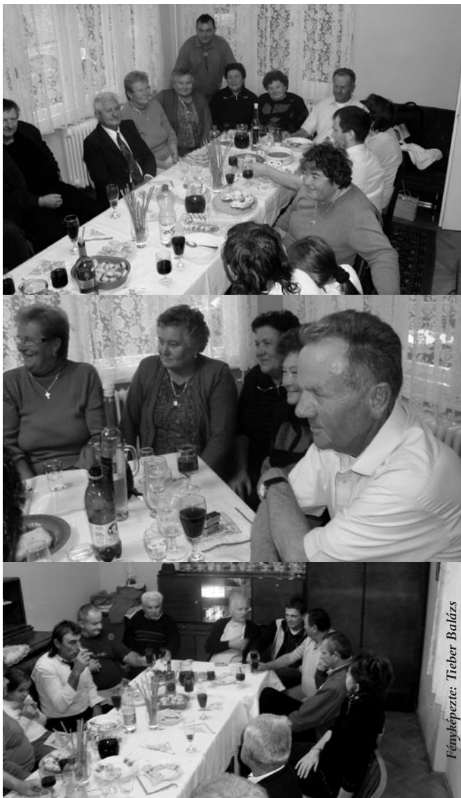
2008. szeptember 21-ei egyházközségi gyűlésre a tagok családtagjai is meghívót kaptak