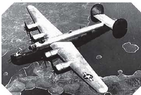
Liberator B-24-es típusú repülőgép