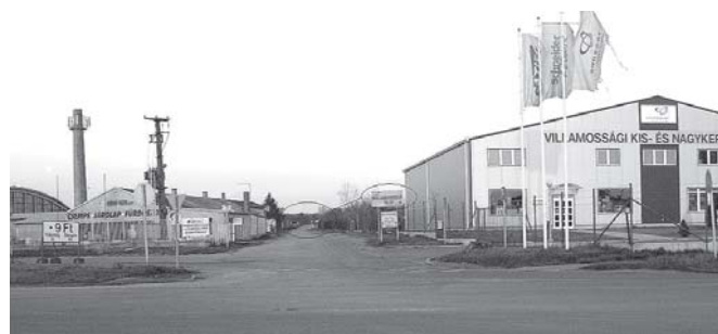
A hulladéklerakó bejárata

Amikor beköltöztünk jött a következő probléma szeméttügyben: csak kéthetente ürítik a kukát, és nekünk csak 120 l-es kukára volt pénzünk. Erre azt találtam ki, hogy ami a már említett