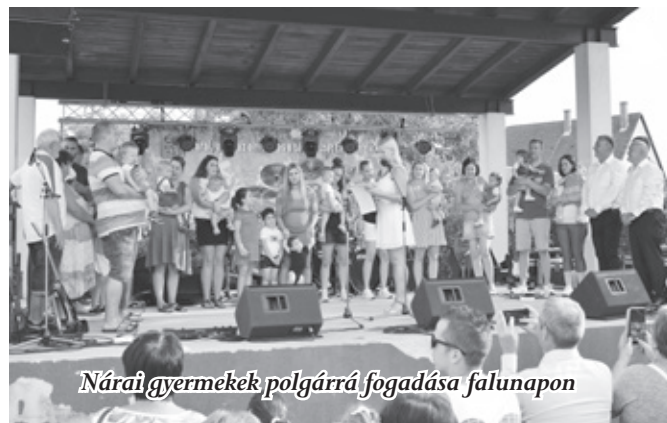
Nárai gyermekek polgárrá fogadása falunapon

ló kerékvágásba. Ez a gyakorlatban azt is jelenti, hogy például nem volt szükséges a helyi adók emelésére év elején Náraiban. Ilyen korábbi döntéseink voltak, hogy középületeink nyílászáróit már évekkkel ezelőtt hőszigeteltre cseréltük. A középületek