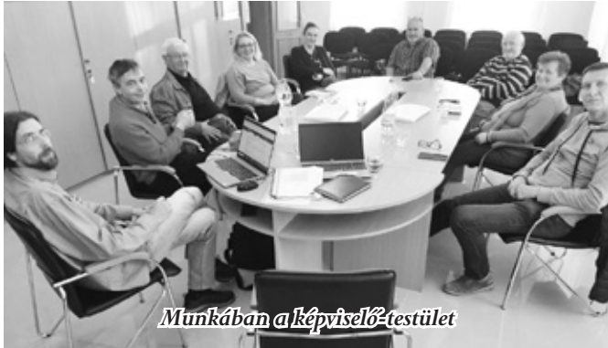
Munkában a képviselő-testület

– A sportkör korábbi nyertes pályázatból vásárolhat közel 2 millió forint értékben két nagy és két új kiskapukat, illetve 3,5 millió Ft TAO támogatásból a sportöltöző épületén külső-belső felújítás valósul meg.